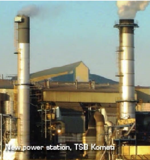
New power station, TSB Komati