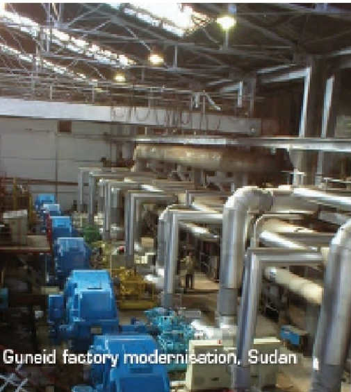
Guneid factory modernisation, Sudan

Desde a sua criação em 1961, a Bosch Projects desenvolveu uma longa história de sucesso e inovação na indústria de açúcar.