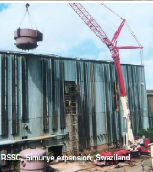
RSSC, Simunye expansion, Swaziland