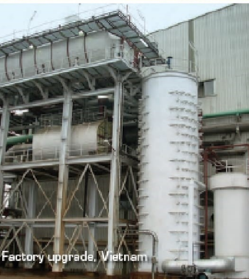
Factory upgrade, Vietnam